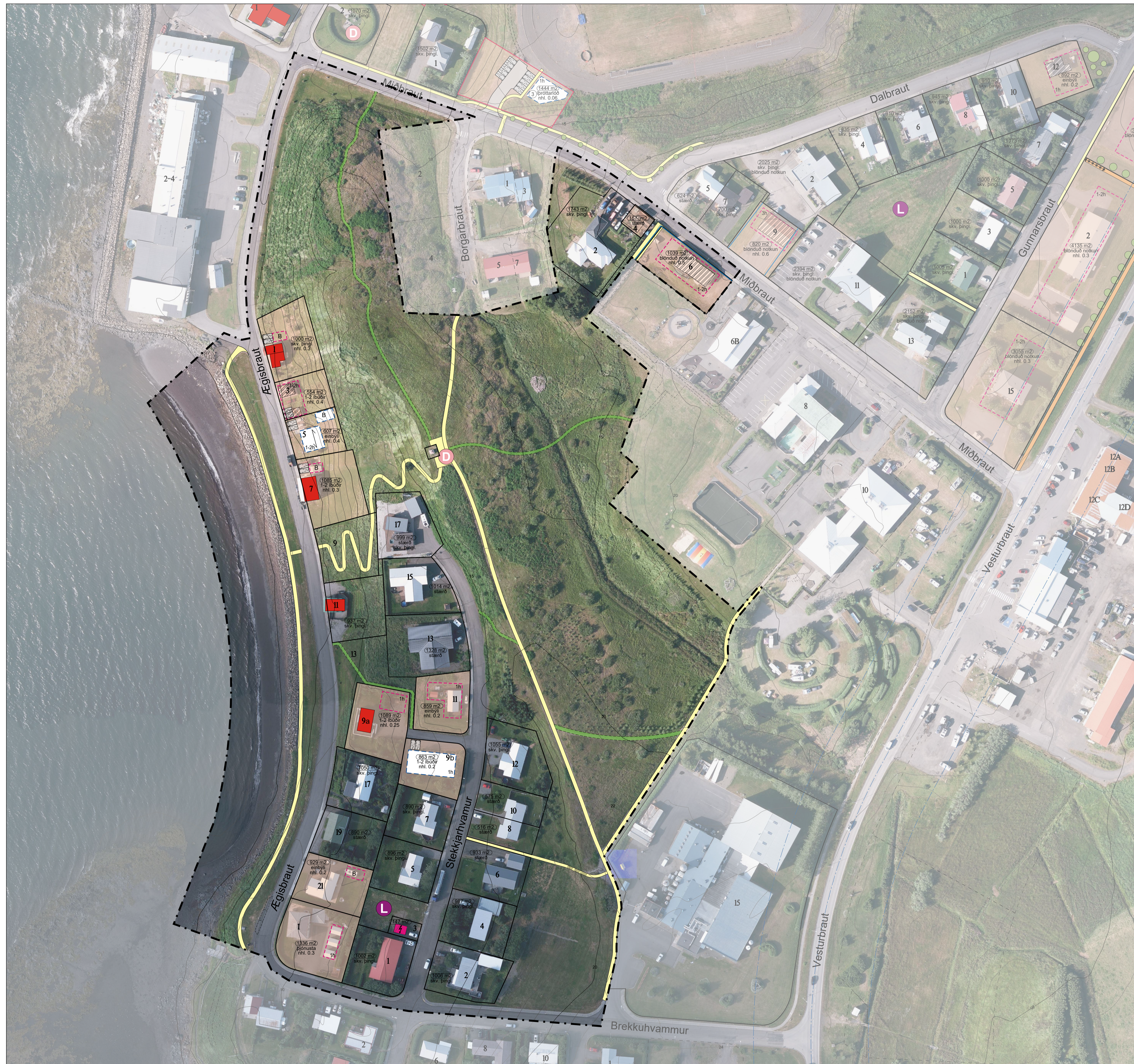
Deiliskipulagstillaga, mkv. 1:1000

Löftmynd er frá 2023 svo hún sýnir ekki núverandi ástand.