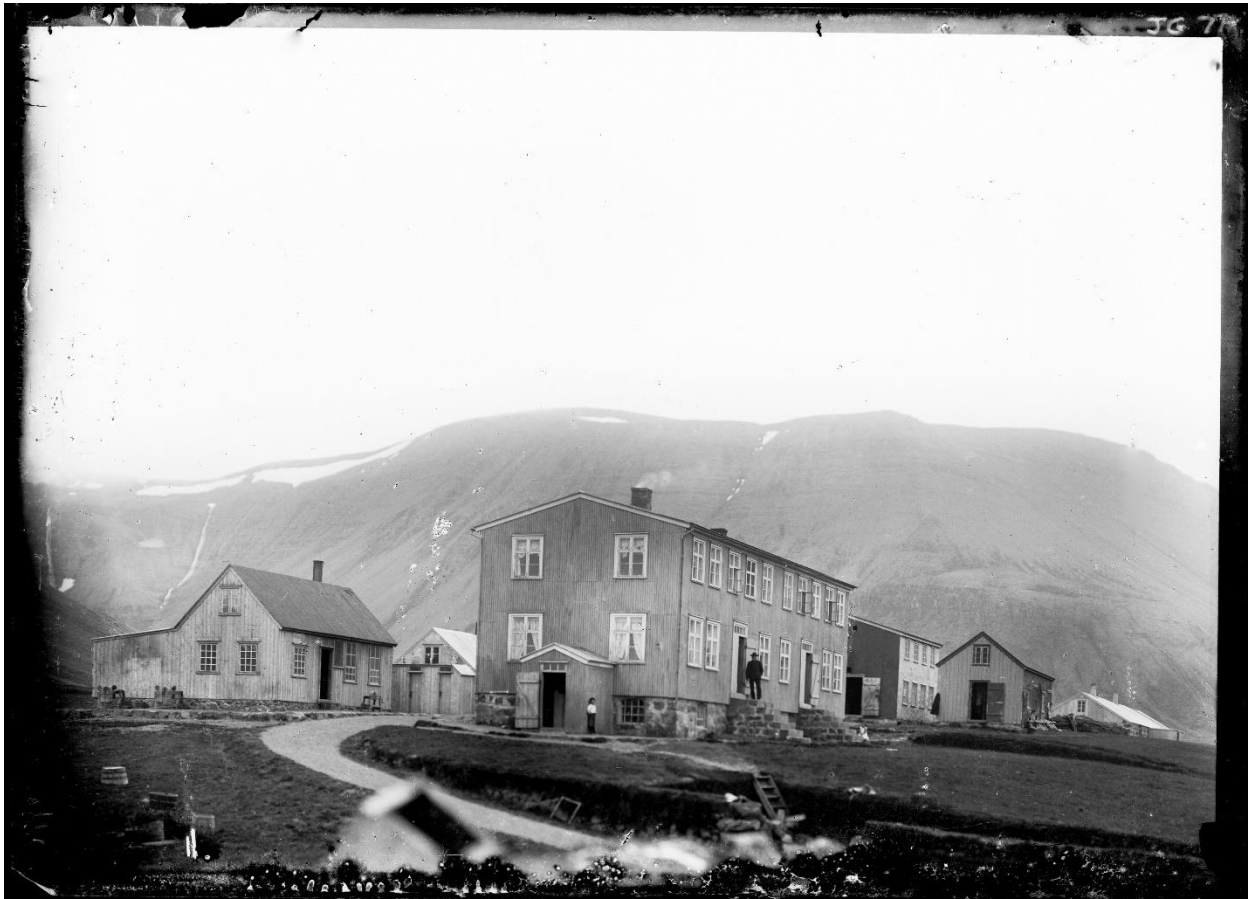
Mynd 1. Mynd af Ólafsdal sem sýnir fjölda bygginga sem risu í Ólafsdal á tíma skólans frá 1880-1907.