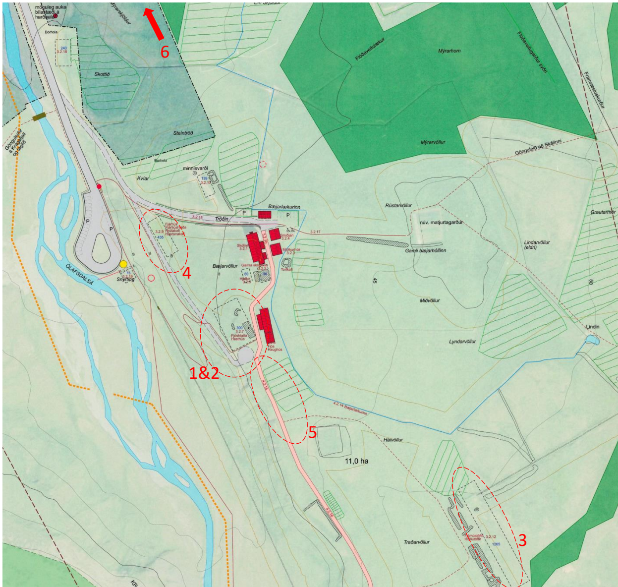
Mynd 4. Hluti úr gildandi deiliskipulagi Ólafsdals.

Samhliða breytnu á aðalskipulagi verður gerð breyting á gildandi deiliskipulagi Ólafsdals í því skyni að byggðin í Ólafsdal verði fýsileg rekstareining og henti sem best til þjónustu við menningar- og náttúrutengda ferðamennsku. Markmið um varðveislu minja um sögu Ólafsdalsskóla og starfsemi hans haldast óbreytt.