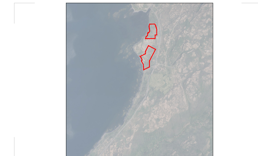
YTRI MÖRK DEILISKIPULAGS - LJÁRSKÓGAR